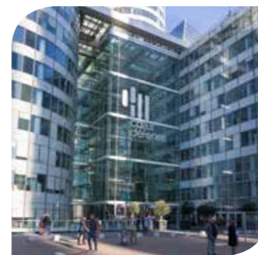
COEUR DÉFENSE (SCI HOLD) - COURBEVOIE (92)