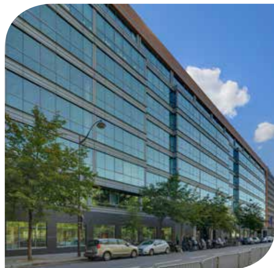
LE VALMY MONTREUIL (93)