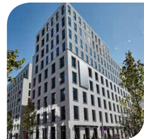
ARDEKO (SCI ARDEKO) - BOULOGNE-BILLANCOURT (92)