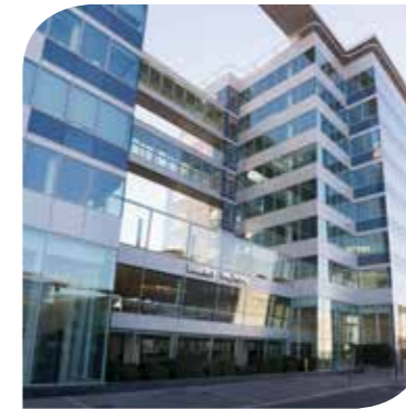
WEST PLAZA - COLOMBES (92)

HQE Exceptionnel, BREEAM Excellent, HQE, Exploitation, BBC