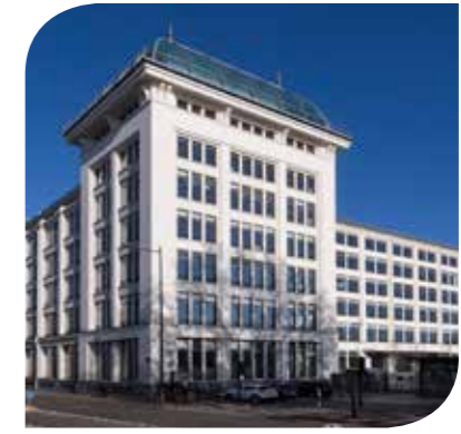
IN & OUT (SCI BOULOGNE LE GALLO) BOULOGNE-BILLANCOURT (92)

Certifié HQE Exceptionnel, BREEAM Very Good, LEED Platinum