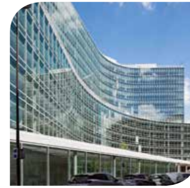
LE JOUR (VIA SCI) PARIS 14 E