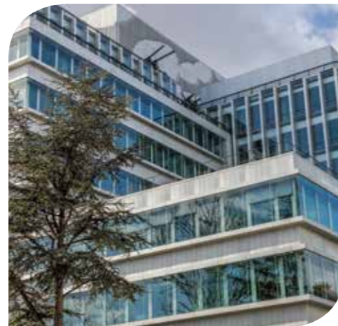
NEWTIME (SCI PREIM NEWTIME) NEUILLY-SUR-SEINE (75)